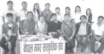
नवौँ जियन संस्था द ओखो सेन्टरले नेपालमा बस्न लागेको राजनीतिक दलका कार्यकर्तालाई अनुरोध गरेको छ ।

गोर्खा न्यूज संवाददाता पोखरा ११ कार्तिक ।