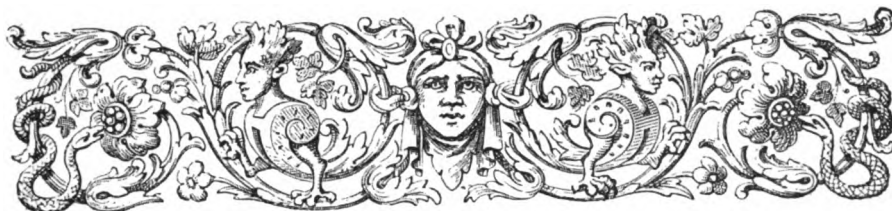
TABLE DES DIVISIONS